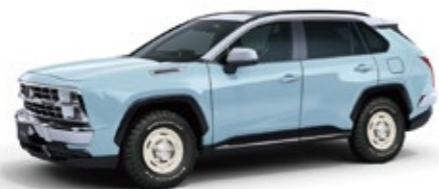
ノースコロライナブルー <B28-M>(ソリッド) / ホワイト <058>(ソリッド)

※画像は 20LX、パノラマムーンルーフ、225/70 R16 アルミホイール&タイヤセット、サイドメッキモール装着車 ※画像の内装色は、メーカーオプション専用レザーシート&トリムセットを選択した場合のボディカラーとの組合せイメージです。ボディカラーに近似した指定の内装色となります。ボディカラーと指定の内装色以外の組み合わせはできません。