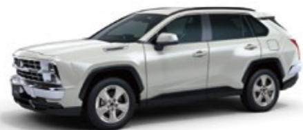
グローブワンホワイトパール <070> ※1

※画像は 20ST ※画像の内装色は、メーカーオプション専用レザーシート&トリムセットを選択した場合のボディカラーとの組合せイメージです。ボディカラーに近似した指定の内装色となります。ボディカラーと指定の内装色以外の組み合わせはできません。