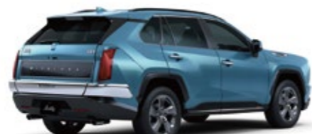
グランジデニムブルーパール <SCA>

※画像は HYBRID DX、サイドメッキモール装着車 ※画像の内装色は、メーカーオプション専用レザーシート&トリムセットを選択した場合のボディカラーとの組合せイメージです。ボディカラーに近似した指定の内装色となります。ボディカラーと指定の内装色以外の組み合わせはできません。